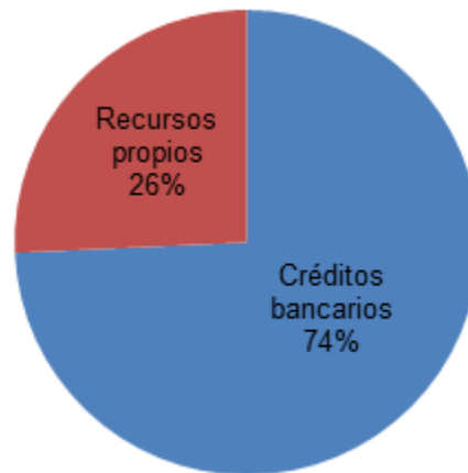
Figura 1. Procedencia de dinero para inversiones