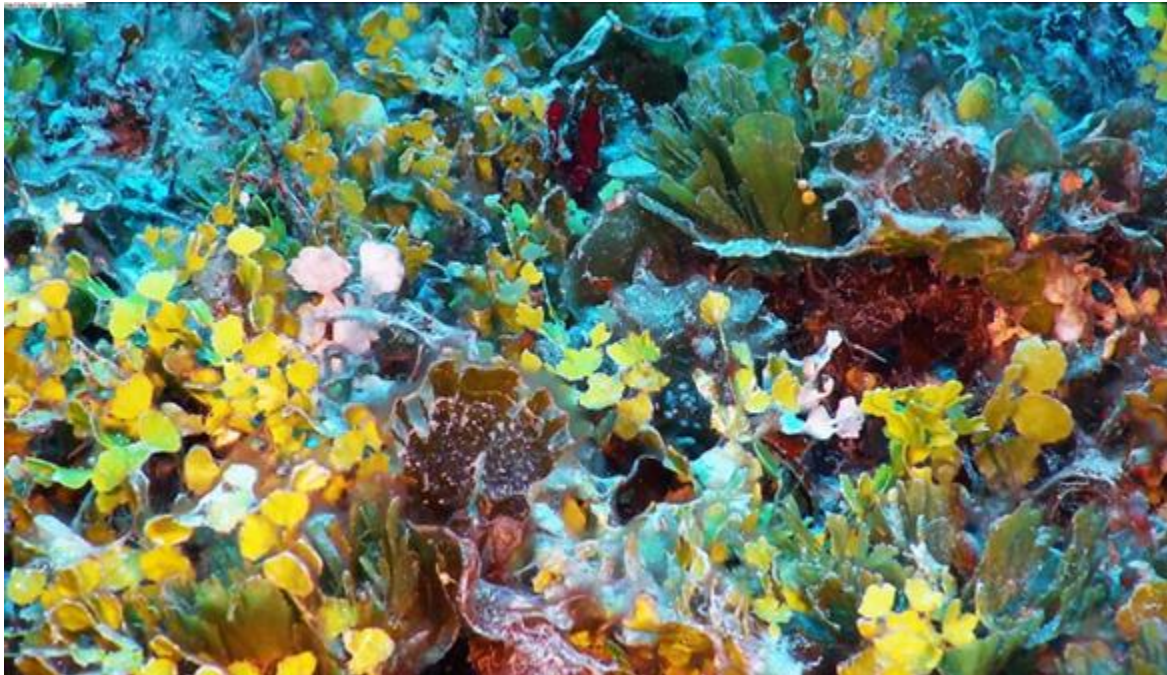
Figura 2. Corales en La Isleta de Manatí