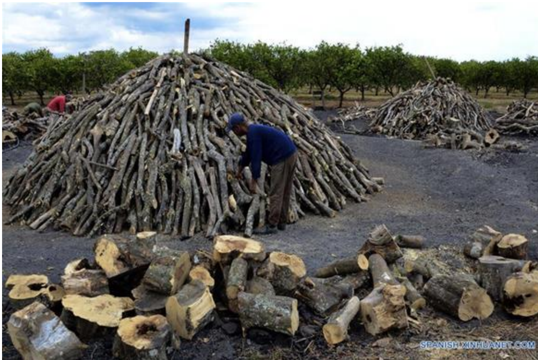
Figura 4. Productores de carbón vegetal en el poblado Los Pinos de Manatí