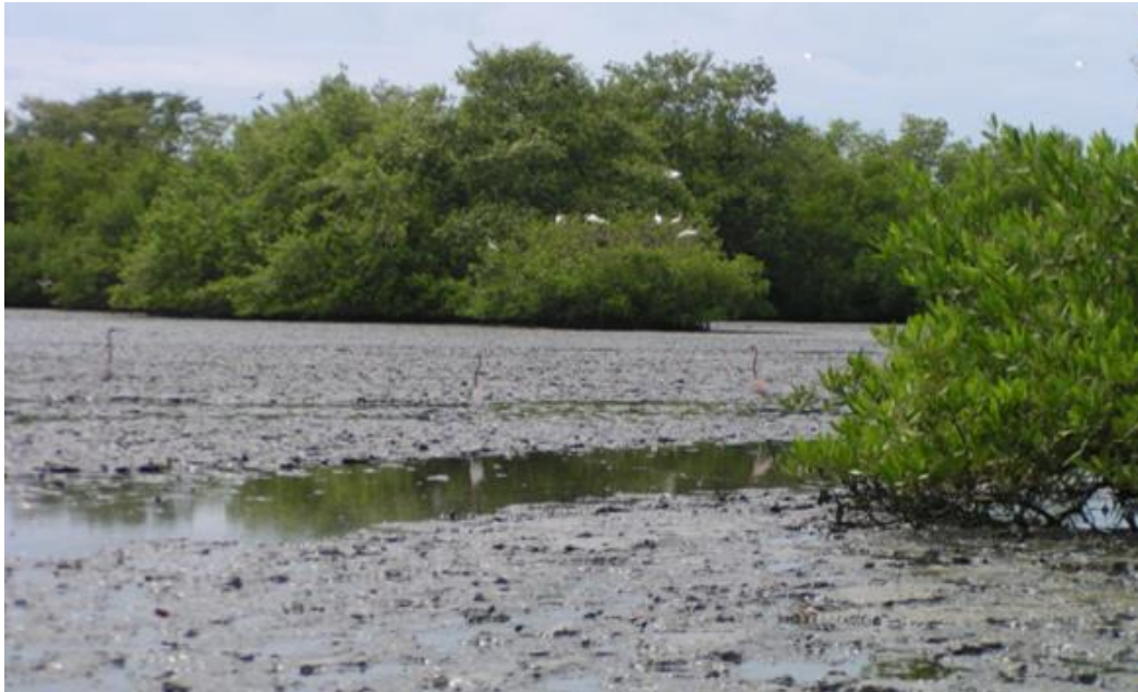
Figura 3. Mangles en La Isleta de Manatí